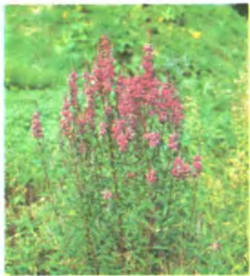
663. Плакун верболистий.